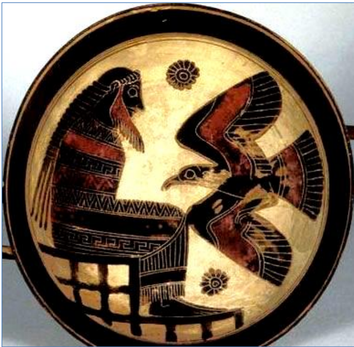
3. Προμηθέας και αετός, κύλικας του 6 ου αιώνα, μουσείο του Λούβρου

2. Πώς περιγράφει τα παθήματά του ο Προμηθέας και για ποιο λόγο ο Δίας τον τιμώρησε με αυτόν τον τρόπο;