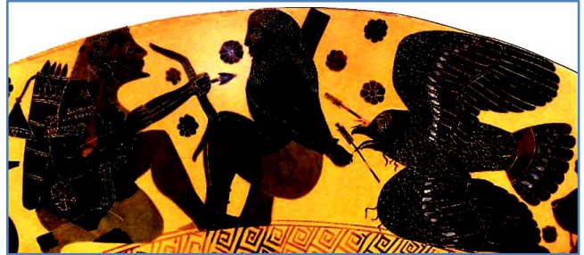
Ηρακλής, Προμηθέας και αετός, από σκύφο του 6 ου αιώνα, Εθνικό Αρχαιολογικό Μουσείο Αθήνας

φωτιά , την έδωσε στους ανθρώπους και τους έμαθε να λιώνουν μέταλλα με αυτή και να κατασκευάζουν εργαλεία. Τότε, ο Δίας εξοργίστηκε! Μετέφερε τον Προμηθέα στον Καύκασο , τον έδεσε με αλυσίδες και κάθε μέρα έστελνε έναν αετό που του έτρωγε το συκώτι. Για 30 ολόκληρα χρόνια ο Προμηθέας βασανιζόταν, ώσπου τελικά απελευθερώθηκε από τον Ηρακλή.